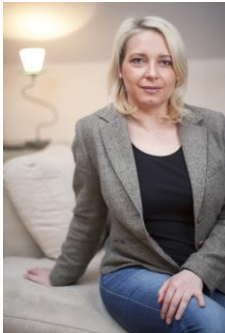
10. Simone Simon