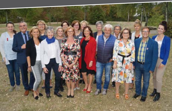
Der Arbeitskreis AIDS / STI Rheinland-Pfalz Nord