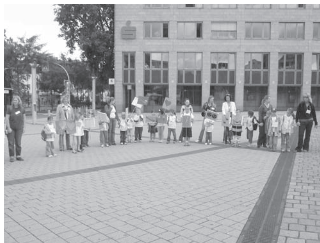
Gesundheit – durch Kinderaugen gesehen – wird auf Schildern präsentiert.

Die Themen der »Elternschule« sind vielfältig: Gesunde Ernährung und Bewegungsförderung, Medienkonsum und Streiten-