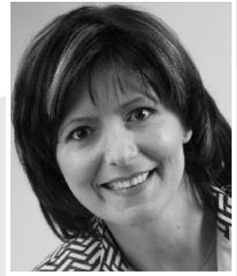
Malu Dreyer Ministerin für Arbeit, Soziales, Gesundheit, Familie und Frauen des Landes Rheinland-Pfalz

ich lade Sie herzlich zum nächsten Mainzer Pflegestammtisch ein. Unser Thema lautet dieses Mal: